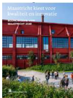
De economische visie 2040