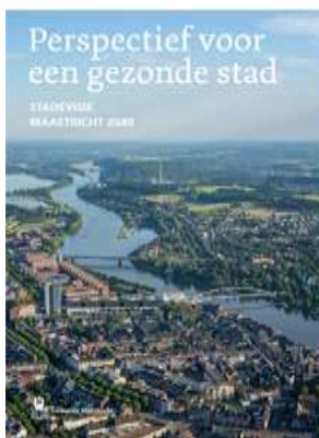
De stadsvisie 2040