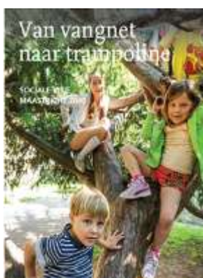
De sociale visie 2040