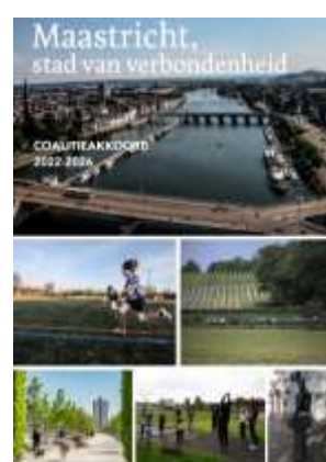
Coalitieakkoord 2022 - 2026

Tijdens de participatieve momenten (zie hoofdstuk 4 voor de planning) en vooraf aan het burgerberaad zullen de kaders ook worden meegegeven. Daarbij kunnen zoals eerder gesteld eventuele uitwerkingen en reacties daarop resulteren in andere uitwerkingen. Bij het meebeslissen, lees bij het burgerberaad, zullen de bestaande kaders aan het begin van het proces worden aangegeven.